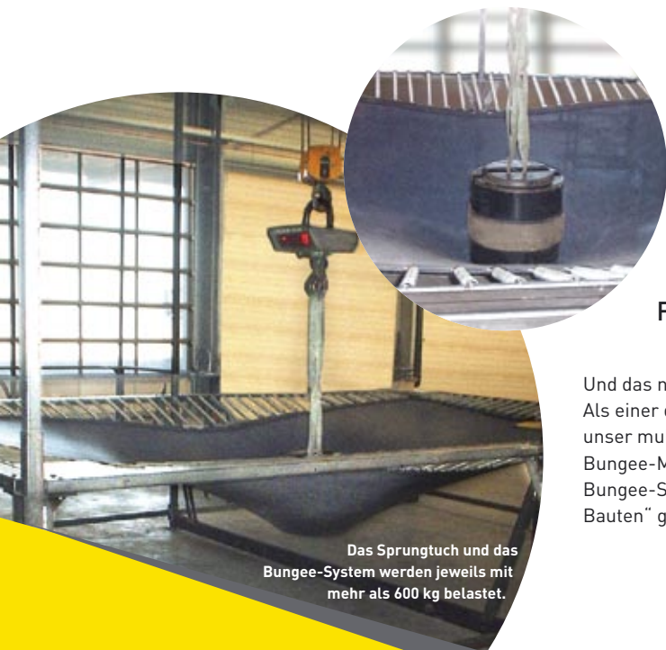
Das Sprungtuch und das Bungee-System werden jeweils mit mehr als 600 kg belastet.