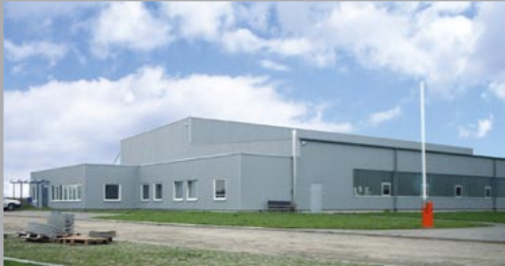
Fertigungsstätte auf der Schwäbischen Alb

Mit Ausnahme von wenigen Zukaufteilen wird unsere MULTITRAMP -Anlage komplett in Deutschland gefertigt. Dies beginnt beim Einkauf der Rohmaterialien und endet beim Verzinken der hochwertig angefertigten Bauteile. Sämtliche Bestandteile Ihrer MULTITRAMP -Anlage wandern bis zur Auslieferung ausschließlich durch die Hände von Profis.